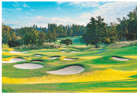
セカンド地点に10個のバンカーを配した17番パ4

◆信楽カントリー倶楽部田代コース 【住所】滋賀県甲賀市信楽町田代767の1 【電話】0748-82-3711 【詳細】「信楽カントリー倶楽部田代コース」で検索